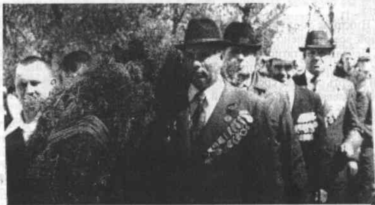
1985 год. Шумиха. 40-летие Победы. Венок славы — к обелиску землякам, погибшим в годы Великой Отечественной войны.